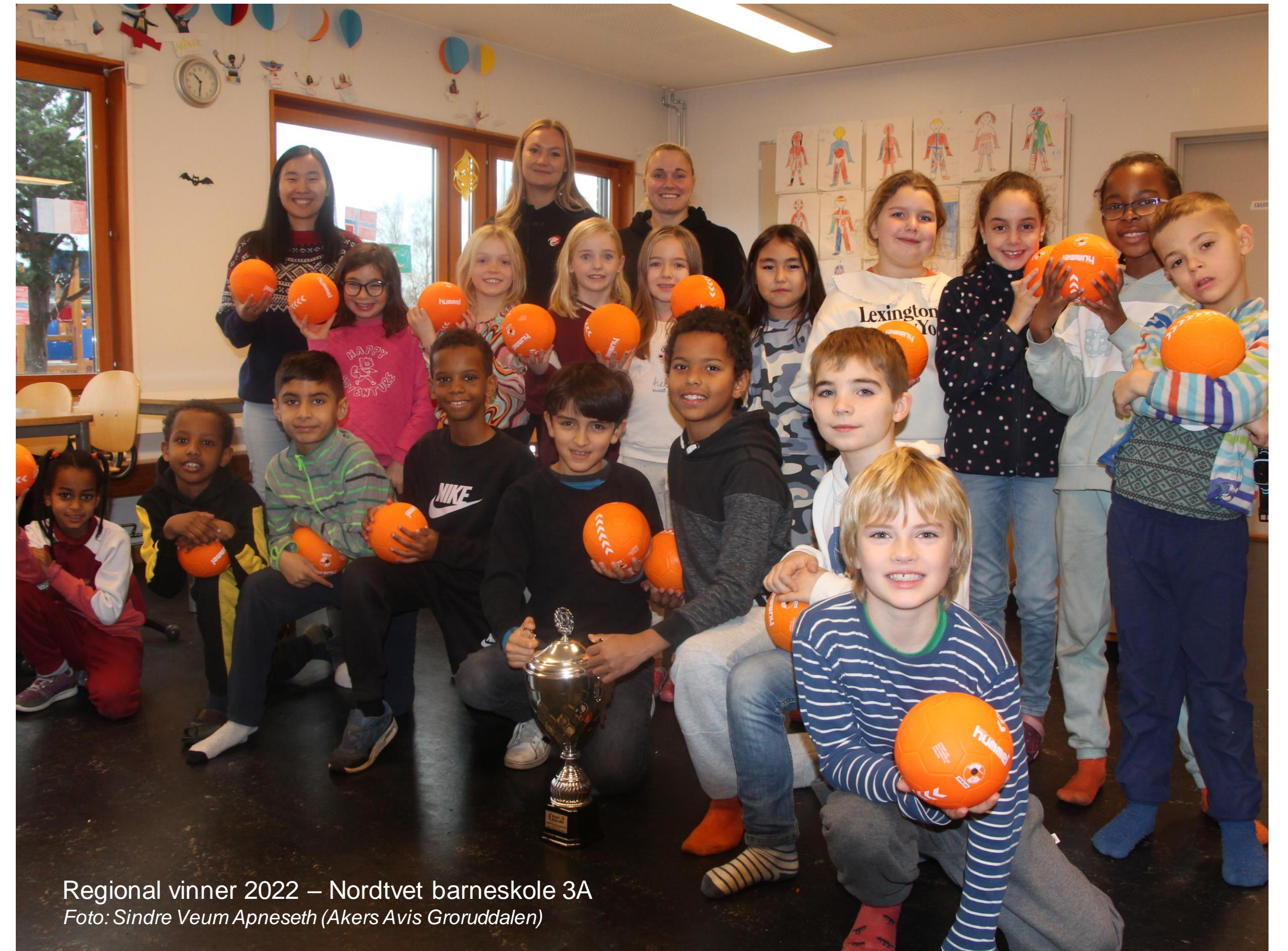
Regional vinner 2022 – Nordtvet barneskole 3A