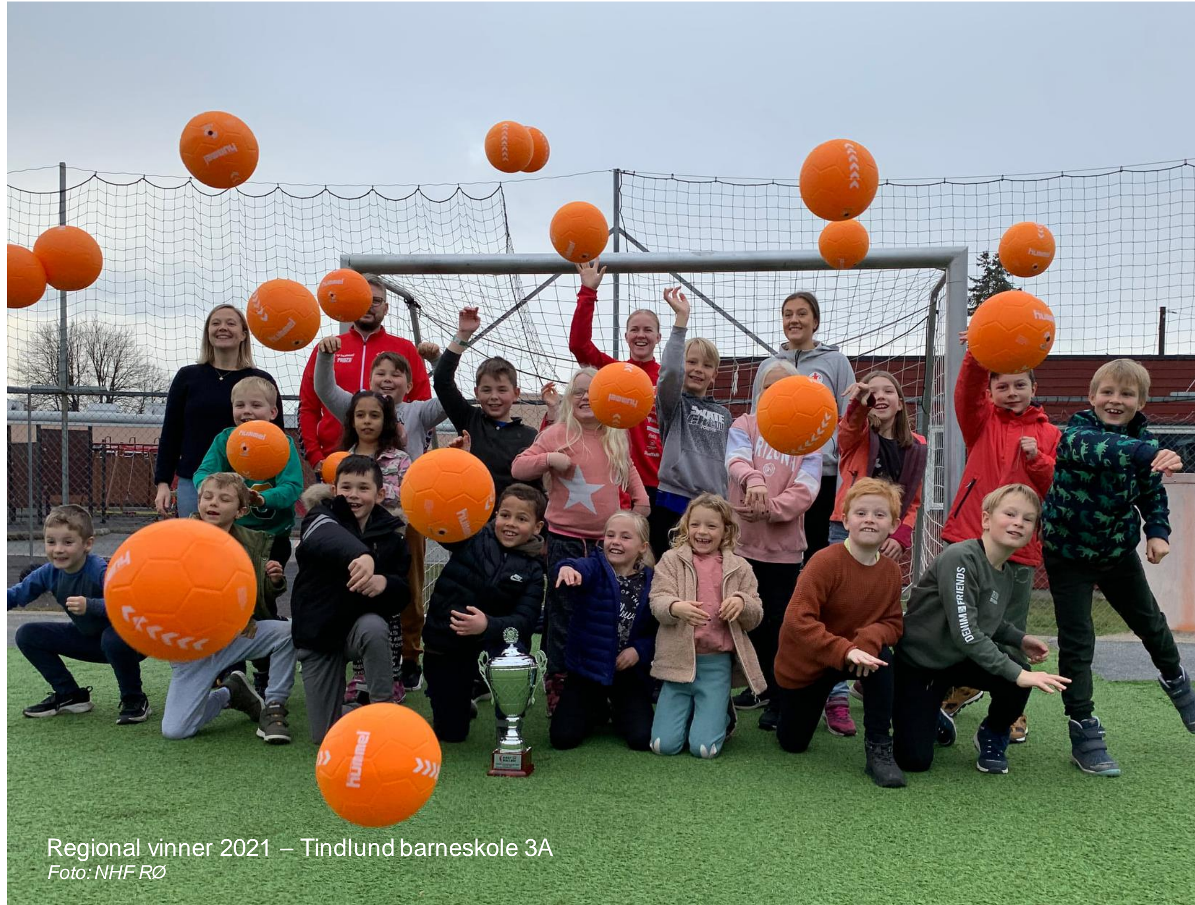
Regional vinner 2021 – Tindlund barneskole 3A